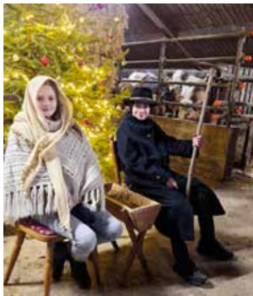
Herberge im Kälberstall

Vielen Dank an alle, die sich an unseren Aktionen beteiligt haben!