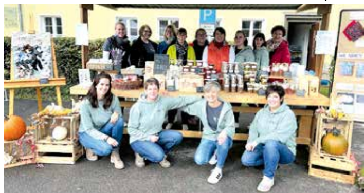
Studierende der Hauswirtschaftsschule Uffenheim bei deren Stand am Handwerkermarkt in Uffenheim.

Im Mittelpunkt der Fachschule stehen praktische Fertigkeiten und breites Fachwissen zur gesunden Ernährung sowie zum Familien- und Hauswirtschaftsmanagement. So lehrt er die fachgerechte Zubereitung vom Schweinebraten bis zum veganen Linsengericht. Fachwissen zur Wäschepflege, Reinigung, Nähen, dem eigenen Gemüseanbau und vieles mehr wird vermittelt. Der Studiengang stärkt die Persönlichkeit und fördert unternehmerisches Denken und Handeln. Er richtet sich an Frauen und Männer mit abgeschlossener Berufsausbildung außerhalb der Hauswirtschaft. Um Bildung, Beruf und Familie zu vereinen, findet der Unterricht in Teilzeitform statt. Der Schulbesuch ist kostenfrei. Weitere Informationen zur Hauswirtschaftsschule erhalten Sie unter www.aelf-fu.bayern.de .