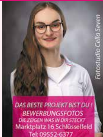
Fotostudio Cella Seven

Es gibt Orte, an denen die Zeit still-zustehen scheint, und doch nagt sie unaufhörlich an allem, was einst lebendig war. Alte Kaugummi-automaten, deren Farben von der Sonne gebleicht und deren Metall von Rost durchzogen ist, stehen oft an Straßenecken, die kaum noch jemand beachtet. Und um sie herum – Dörfer, die ebenso langsam verblasen wie die Erinnerungen an das, was sie einst waren.