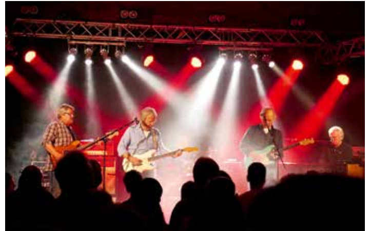
Unser Foto zeigt Converted beim letzten Auftritt in Burghaslach.