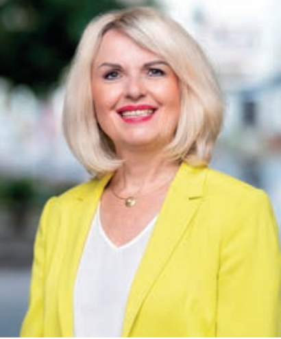
LANDRÄTIN TAMARA BISCHOF